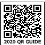
2020 QR GUIDE

குறிப்பு: இணையச் செயல்பாடுகள் மற்றும் இணைய வளங்களுக்கான QR code களை Scan செய்ய DIKSHA அல்லாத ஏதேனும் ஓர் QR code Scanner ஐ பயன்படுத்தவும்.