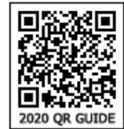
2020 QR GUIDE

குறிப்பு: இணையச்செயல்பாடுகள் மற்றும் இணைய வளங்களுக்கான QR code களை Scan செய்ய DIKSHA அல்லாத ஏதேனும் ஓர் QR code Scanner ஐ பயன்படுத்தவும்.